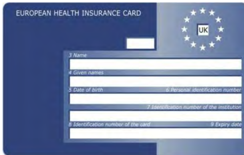
Vorderseite Vereinigtes Königreich - Wales