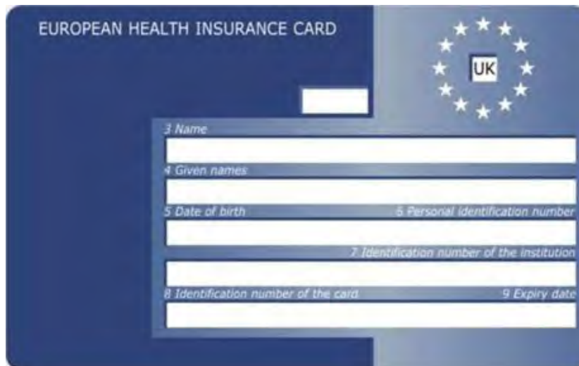
Vorderseite Königreich – England – Schottland