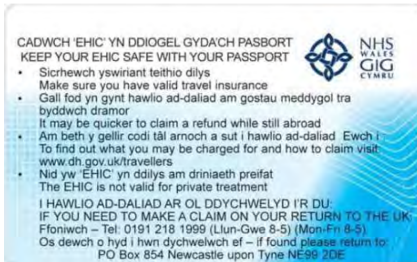
Rückseite Vereinigtes Königreich - Wales