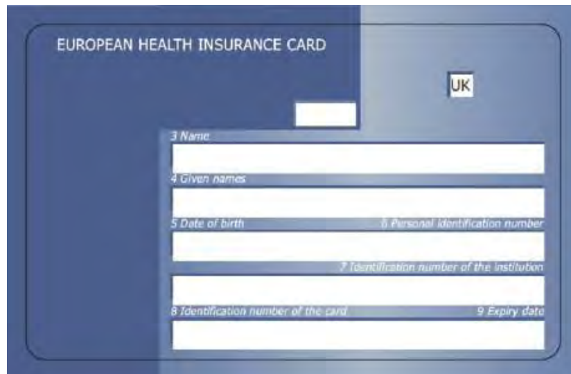
Vorderseite Vereinigtes Königreich