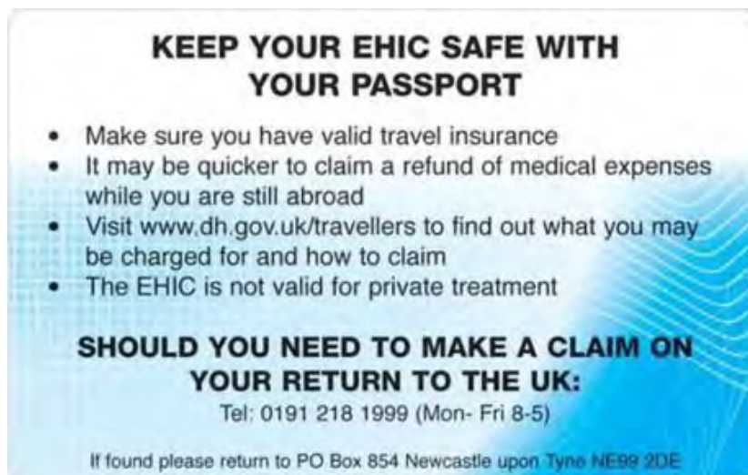
Rückseite Vereinigtes Königreich – England – Schottland