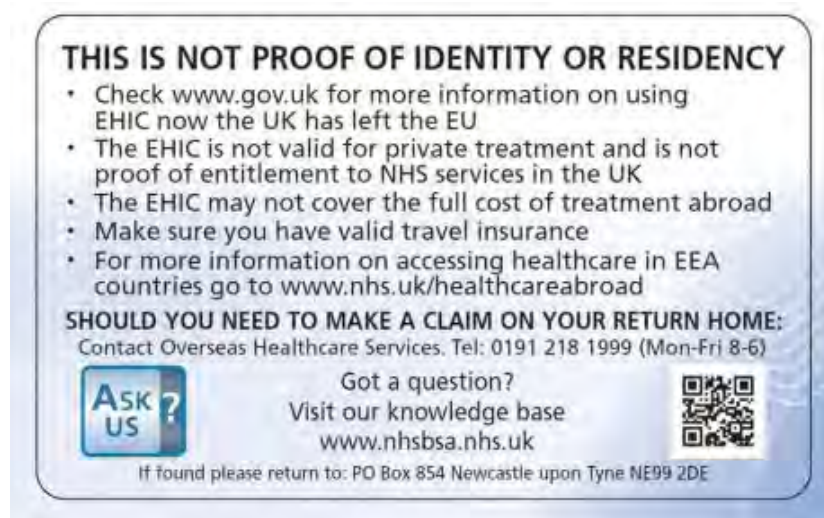
Rückseite Vereinigtes Königreich

Britische EHICs im alten Design mit und ohne EU-Logo bleiben weiterhin bis zu ihrem Ablaufdatum gültig. Sie werden bei Neuanträgen durch die Global Health Insurance Card (GHIC) ersetzt.